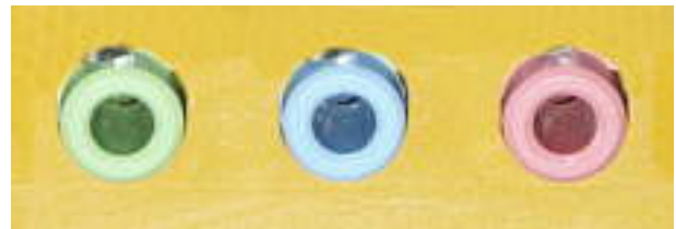
Blaue Buchse = Line In

Staren Sie Ihr Musikbearbeitungsprogramm auf dem Computer, machen Sie eine Probeaufnahme und pegeln Sie die Aussteuerung mit dem lautesten Musikstück richtig ein. Danach starten Sie die Aufnahme im Softwareprogramm und die Wiedergabe der CD / DVD-Players.