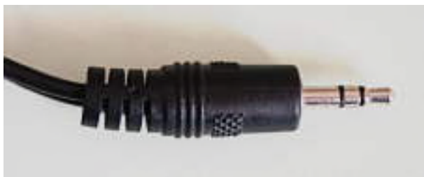
Klinkenstecker 3.5 mm Ø